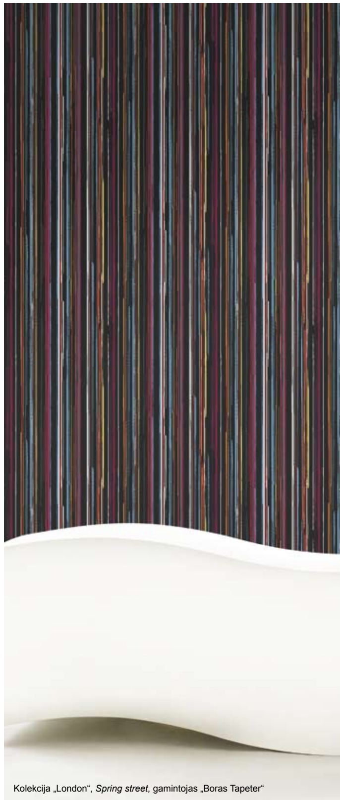
Kolekcija „London“, Spring street , gamintojas „Boras Tapeter“